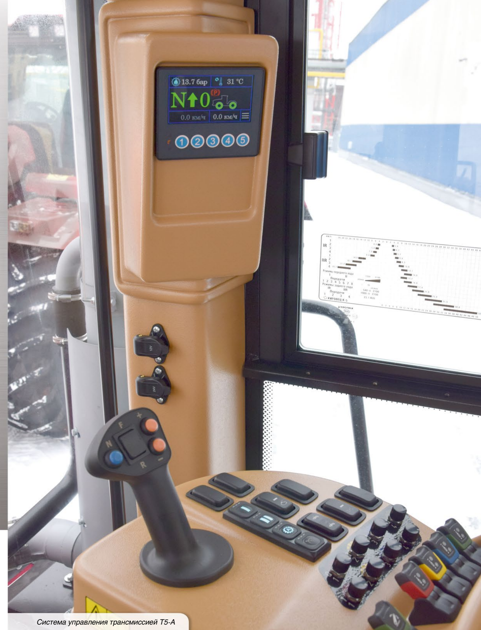
Система управления трансмиссией Т5-А

сельскохозяйственные тракторы 250 и 300 л.с.