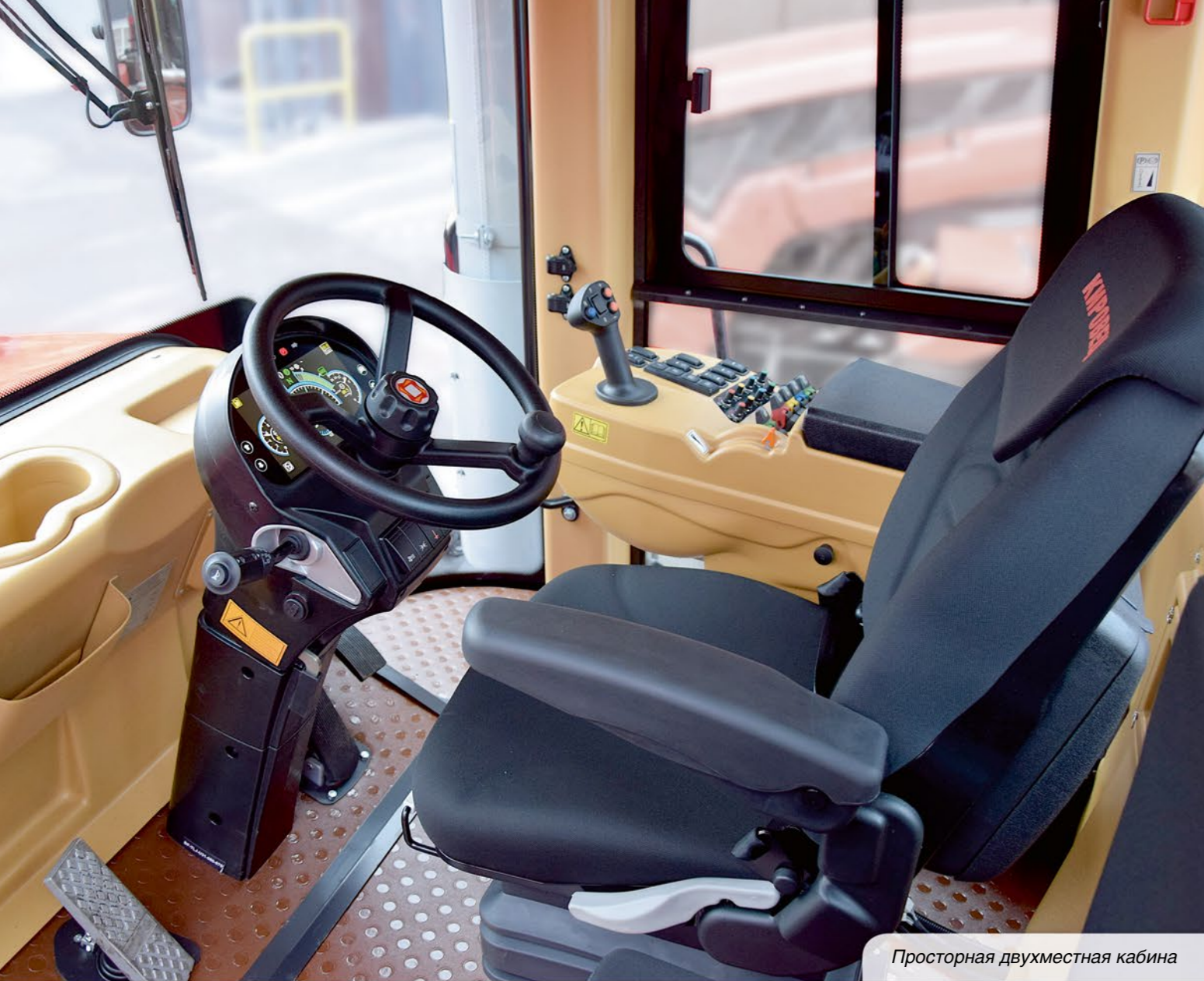
Просторная двухместная кабина